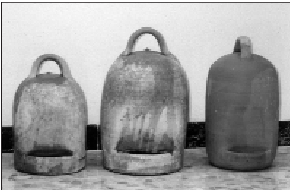
Bebederos para aves.

Los conejos sobrantes del consumo familiar se vendían al CONEJERO, que con frecuencia visitaba la localidad, la venta se hacía en “libras”, en Torrelacárcel se utilizaba la “libra corta”, equivalente a 342 gr. 22 .