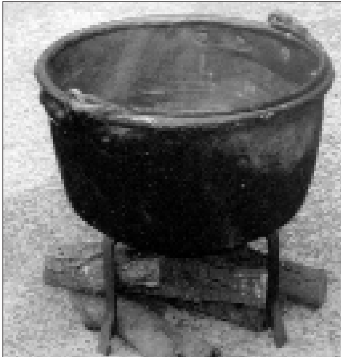
Caldero de cobre.

El CEBO de los cerdos se realizaba en unos 18 meses. Pasaban dos veranos antes ser sacrificados. Al principio se sometían a una alimentación de subsistencia, de pasar el tiempo (“mal pasar”), y sólo al final se forzaba la alimentación para conseguir el cebo deseado 17 .