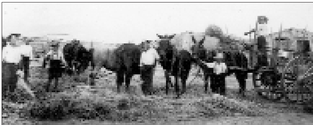
Extendiendo la parva.

Los équidos se castraban al año y medio o dos años, para que no afectase a su desarrollo y resultase lo menos traumática posible. Se admitía que la castración disminuía la fuerza del animal pero que era necesaria. Los équidos “enteros”, es decir, sin castrar (sin “capar”), son de muy difícil manejo, incluso peligrosos para sus cuidadores o guías y para los otros animales.