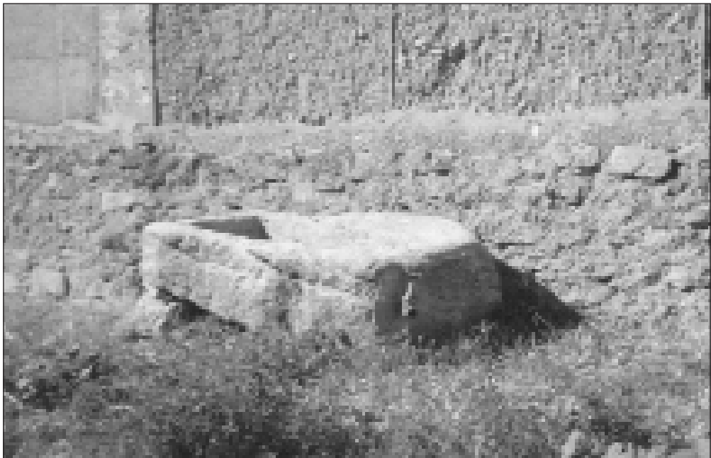
Pila de piedra.

Los ACCIDENTES eran frecuentes, las cojeras eran habituales, como consecuencia de las pedradas del pastor o el acoso del perro. Las cojeras por rotura de algún hueso las curaba el pastor, entablillando la extremidad.